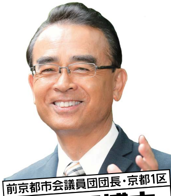
前京都市議員団団長・京都1区