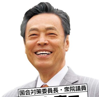
国会対策委員長・衆院議員