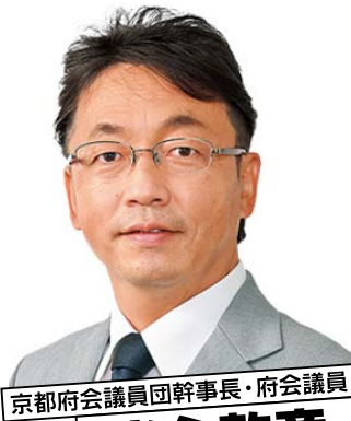
京都府会議員団幹事長・府会議員